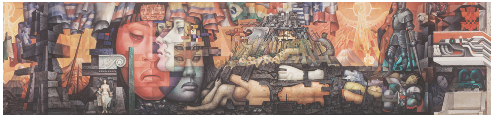
Mural "Presencia de América Latina" Pinacoteca Casa del Arte Universidad de Concepción Chile